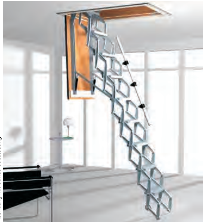
Abbildung mit Sonderausstattung