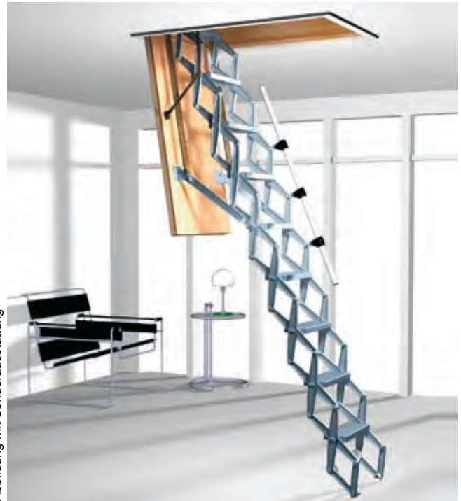
Abbildung mit Sonderausstattung