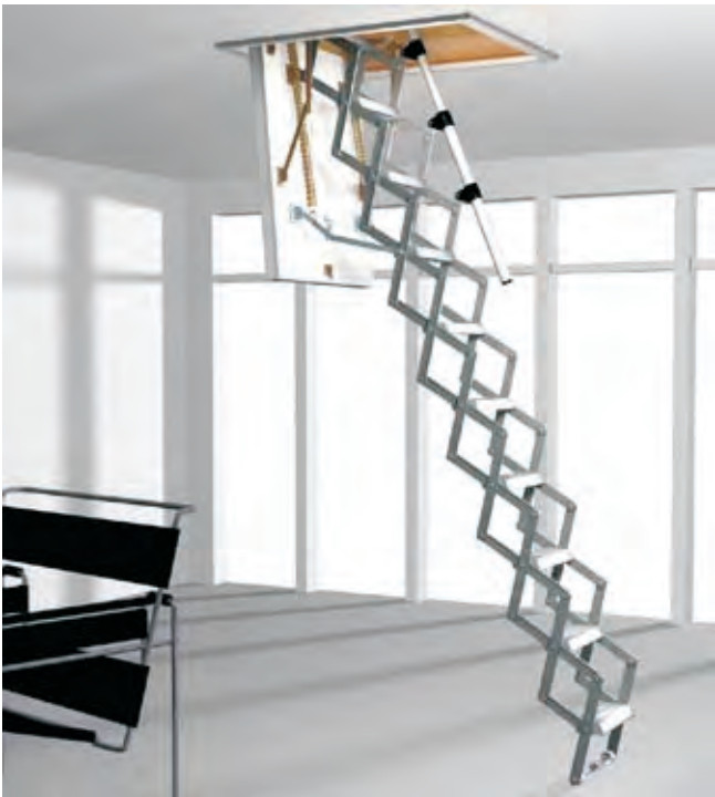
Abbildung mit Sonderausstattung